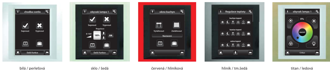
bílá / perleťová