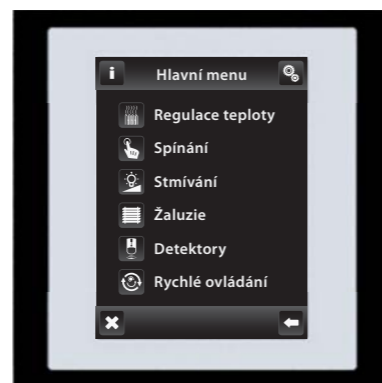
černá / bílá